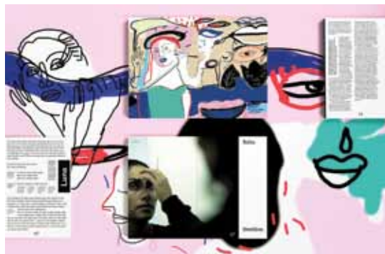
Editorial & Communication Design Gold für die Agentur Studio Es für den Kunden Österreichische Liga für Menschenrechte, Liga Magazin.