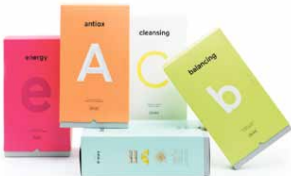
Verpackungsdesign Gold für die Agentur moodley brand identity für den Kunden Ringana GmbH, Reine Zutaten. Echte Wirkung.