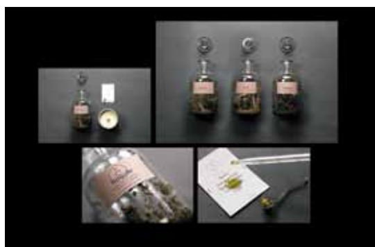
Verpackungsdesign Gold für die Agentur Riebenbauer Design GmbH für den Kunden Buchgraber GmbH & Co KG, Respekt, Stolz, Hingabe seit 1911.