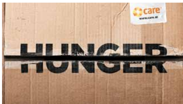
Out of Home: Klassische Werbeformen Gold für die Agentur Wien Nord Werbeagentur GmbH für den Kunden Care Österreich.