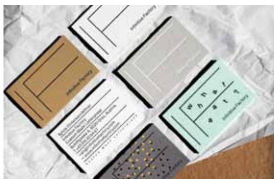
Corporate Design Gold für die Agentur Bruch – Idee&Form für den Kunden Infinity Factory.