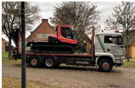
Promotion & Verkaufsförderung & PR-Aktion/Idee des Jahres Gold für die Agentur SR1 Werbeagentur GmbH für den Kunden TV Seefeld, Seefelder Pistenraupe, Kampagne: Bleib original.