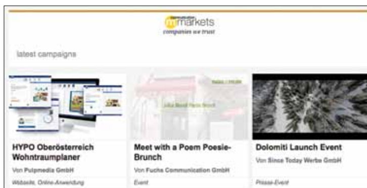
Die neuesten xpert-Kampagnen erscheinen nun auch im medianet Newsletter.

Das Social Media-Netzwerk für Marketing- und Kommunikationsexperten, bizbook , ist ein