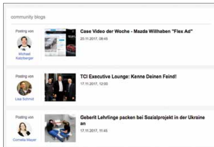
Blogs, so weit das Auge reicht, finden sich ebenfalls im bizbook .