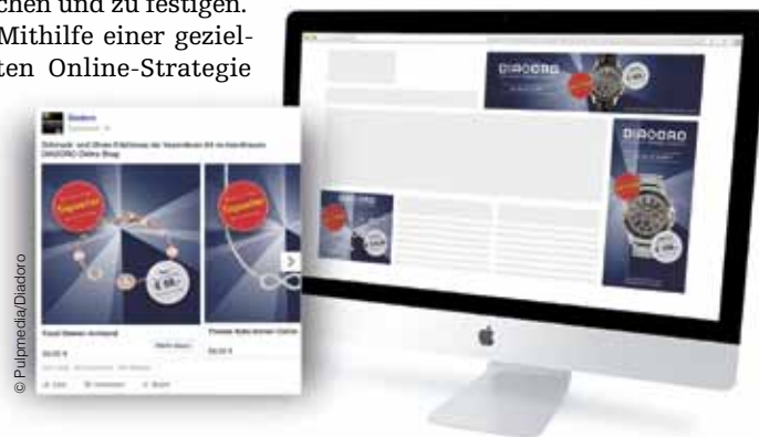
Die Juwelier-Verbund-Gruppe Diadoro hat nun einen gemeinsamen Onlineshop – Konzeption, Umsetzung und Bewerbung dessen stammen von Pulpmedia.

Im Rahmen dieser Strategie wird für Awareness gesorgt, daran gekoppelt sind Performance-Maßnahmen, die den Warenkorb zum Glücken bringen sollen. Zudem sind bedarfsdeckende Maßnahmen integriert – so wird gefunden, was gesucht wird. (gs)