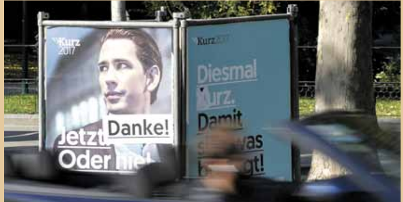
Die ÖVP hat lt. Focus am meisten Geld in NR-Wahlwerbung gesteckt. Bei den Plakatkosten waren die Grünen vorn. Die Liste Pilz kam mit nur einem Plakat über die Runden.

Im Jahr 2016 betrug der Bruttowerbewertung digitaler Außenwerbung (DOOH) in Österreich rund 40,32 Mio. €. Zum Vergleich: Noch im Jahr 2009 belief sich der Bruttowerbewertung auf lediglich 9,52 Mio. € (Quelle: Focus MR). DOOH gilt als absoluter Wachstumsmarkt.