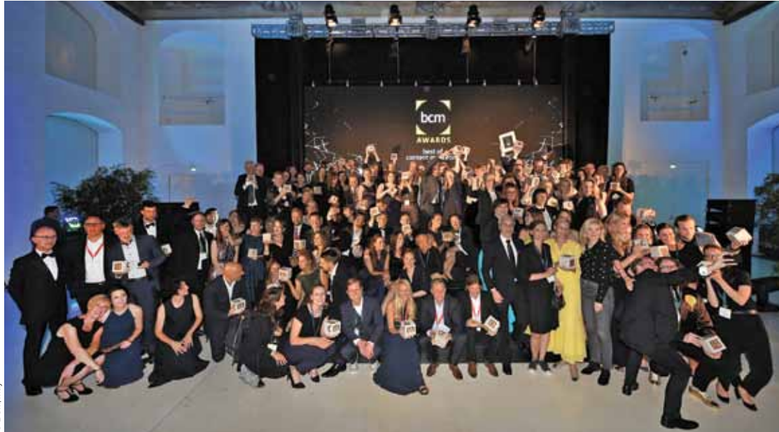
Die zahlreichen Sieger des Best of Content Marketing Award – 67 Preisträger durften sich heuer über Gold freuen.