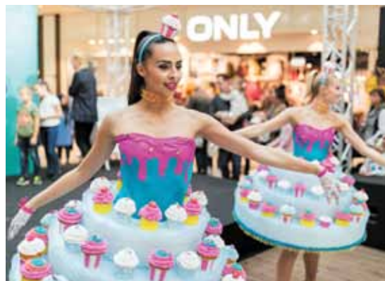
Cupcake-Walking-Acts im huma eleven Shopping Center.