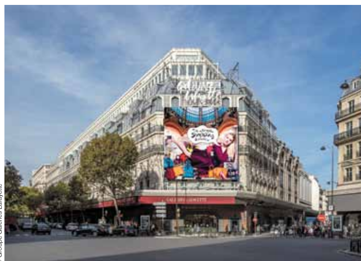
Die Modemetropole Paris war 2018 das Mekka der Shoppingtouristen

Gedämpft wurde die Kauflaune der ausländischen Gäste allerdings Ende des Jahres durch die Proteste der Gelbwesten; betroffen war vor allem Paris. Hier lagen Anfang Dezember die Shoppingumsätze 66% unter jenen der Vorjahresperiode. (red)