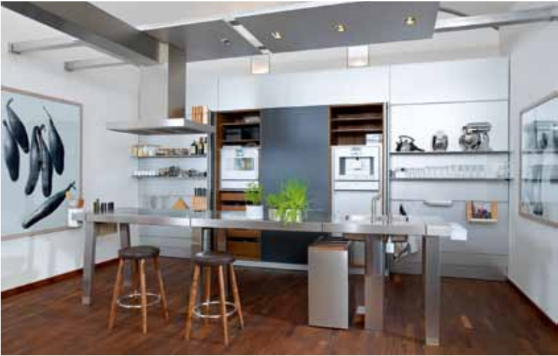
bulthaup Spittelberg präsentiert in seinem Showroom in unmittelbarer Nähe des Wiener MuseumsQuartiers Küchen als ganz besondere Lebens- und Genusswelten.