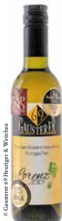
© Gausterer 69 Heuriger & Weinbau

Am 5. Dezember 2015 gelesen und als Trockenbeerenauslese ausgebaut; 7,2% Vol., süß, bernsteinfarbig, mit einer Honig-Dörr-Obstduftnote, am Gaumen eine vollmundige raffinierte Süße mit einem opulenten, säurebetonten und intensiven Abgang. 375 ml 15,60 €