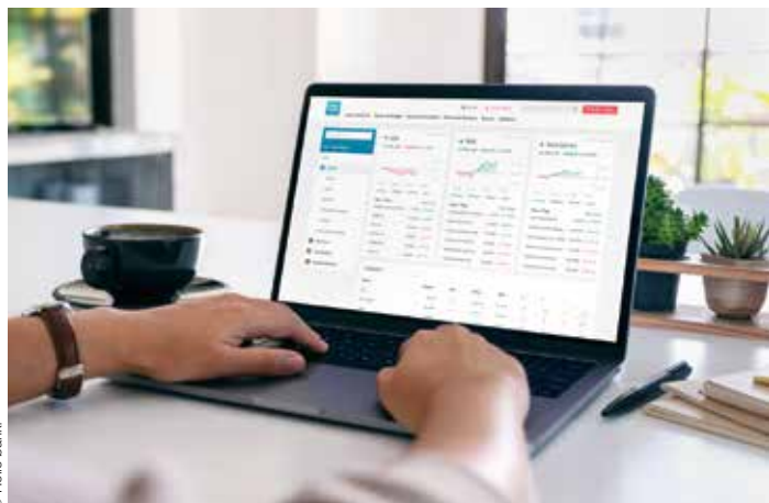
Risikoloses Kennenlernen des Wertpapiermarkts mit dem Musterdepot.

Das Hello bank!-Musterdepot ist bequem auf allen gängigen Geräten aufrufbar, etwa zur Hinterlegung von Kursalarmen zur komfortablen Beobachtung der Performance oder zum Üben des schnellen und überlegten Eingreifens im Echtfall.