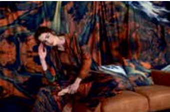
Produziert wird die Indoor + Outside-Kollektion in Österreich.

Die Kollektion umfasst Speise- und Kaffee-Service sowie Schüsseln, Schalen, Kerzenhalter, Vasen und einen Aschenbecher. (red)