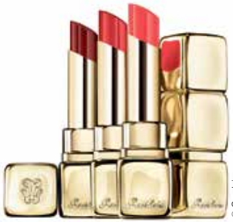
Mehrwert: prächtige Farben, viel Pflege und natürliche Inhaltsstoffe.

Paris. Kiss Kiss Bloom, die neue Lippenstift-Kollektion von Guerlain, überzeugt nicht durch eine große Farbpalette – insgesamt stehen 20 Nuancen von Rosé über Rot bis Beere zur Wahl –, sondern versorgt die zarte Haut der Lippen auch mit viel Feuchtigkeit. Weiterer Pluspunkt ist, dass 95% der Inhaltsstoffe natürlichen Ursprungs sind. (red)