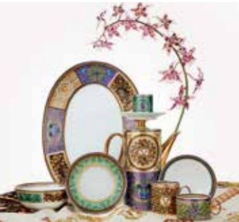
Die Formen sind puristisch, das Dekor dafür besonders üppig.

Paris. Kiss Kiss Bloom, die neue Lippenstift-Kollektion von Guerlain, überzeugt nicht durch eine große Farbpalette – insgesamt stehen 20 Nuancen von Rosé über Rot bis Beere zur Wahl –, sondern versorgt die zarte Haut der Lippen auch mit viel Feuchtigkeit. Weiterer Pluspunkt ist, dass 95% der Inhaltsstoffe natürlichen Ursprungs sind. (red)