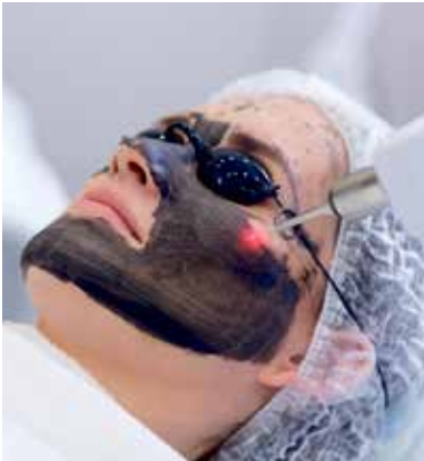
Aya Aesthetics setzt auf sanfte Methoden zur Bekämpfung von Falten.

In diesem Umfeld positioniert sich jetzt ein neuer heimischer Player, der mit hohen technischen Qualitätsstandards und mondäner Club-Lounge-Atmosphäre aufwartet: Aya Aesthetics, eine Marke der Laser Lounge GmbH. Standort ist The Icon Vienna, ein Tower und Bürokomplex beim Areal des neuen Wiener Hauptbahnhofs im Quartier Belvedere. Die über 400 m² große Beauty-Lounge im 15. Stockwerk bietet den Schönheit-suchenden auch einen einmaligen Ausblick über Wien. „Hightech-Beauty“ ist ein Markt mit Potenzial; Experten erwarten