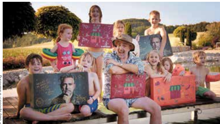
Weihnachtswerbung im Sommer mit Spitzenkoch Roland Trettl.

Mit Stay Spiced! setzte die Agentur auf Weihnachtswer-