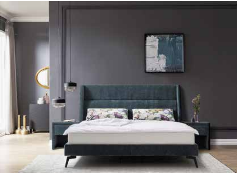
Das Schlafzimmer ist eines der Themen, dem sich der neue Guide ausführlich widmet.

Darüber hinaus wurden vier Sonderpreise in den Kategorien Lebenswerk, Neueröffnung, Familienunternehmen und internationaler Flagship-Store an Unternehmerpersönlichkeiten vergeben, die mit außergewöhnlichen Leistungen Österreichs Einrichtungsszene prägen.